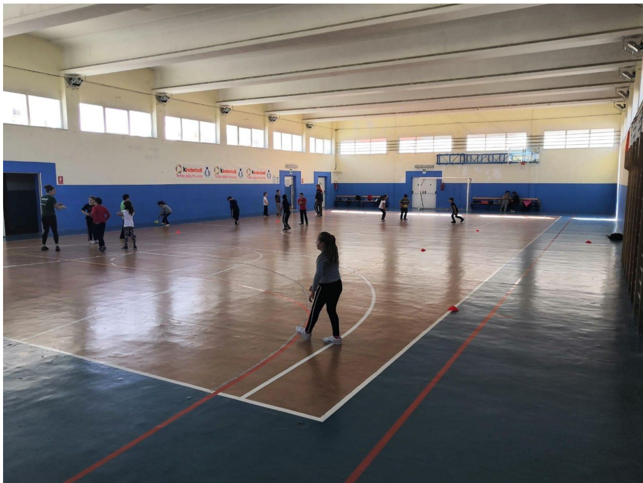
Palestra San Giuliano – Casa Santa, Erice

Altra struttura in uso per allenamento dei più piccoli fino all'under 13/15/17 è la Palestra Comunale San Giuliano sita a Casa Santa Erice.