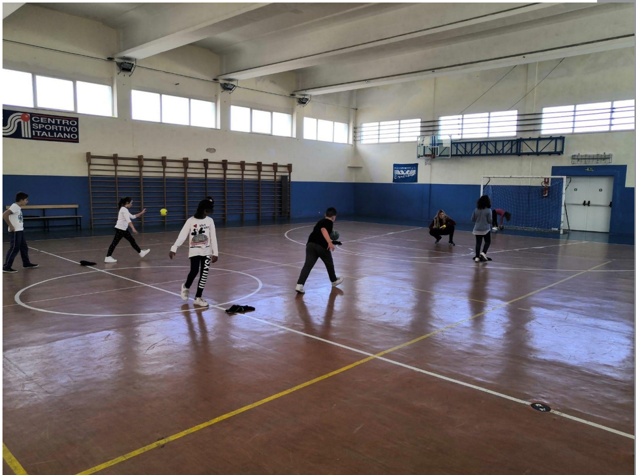
Palestra San Giuliano – Casa Santa, Erice